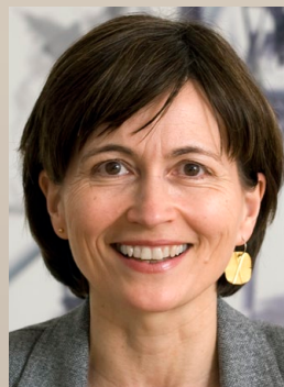
Regula Rytz Präsidentin der Grünen Schweiz, Nationalrätin